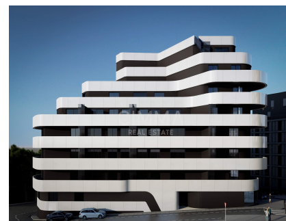
Piscina comunitaria, Todo exterior, Trastero,

Mayor comodidad y seguridad tanto para residentes como para visitantes.