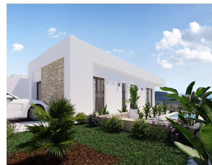
Jardín, Piscina privada, Todo exterior,