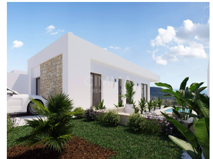
Jardín, Piscina privada, Todo exterior,