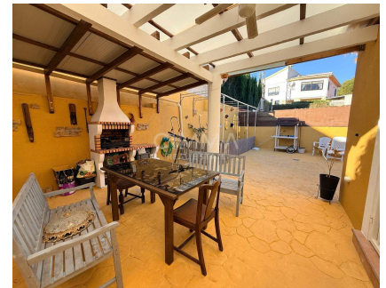
Armarios empotrados, Balcón, Jardín, Terraza, Todo exterior, Trastero,