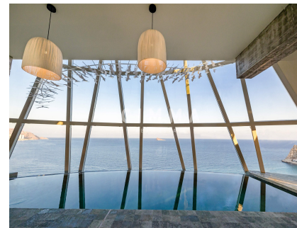
Ascensor, Piscina comunitaria, Todo exterior,

Último apartamento disponible por 1100000€. ¡Contáctanos!