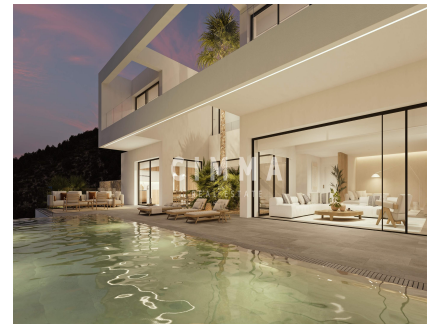
Barbacoa, Jardín, Solárium,

Villa Irati no es solo una casa: es una declaración de estilo y exclusividad, concebida para quienes buscan un hogar donde el diseño, el confort y las vistas al mar se funden en una experiencia de vida única.