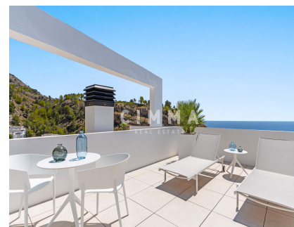
Alarma robo, Ascensor, Piscina privada, Solárium, Todo exterior,

Desde el primer paso dentro de la vivienda, el paisaje se convierte en protagonista. Los atardeceres dorados, las vistas despejadas y la sensación de calma constante hacen de Blanc-19 una auténtica expresión del estilo de vida mediterráneo, donde la naturaleza, la arquitectura y la tranquilidad conviven en perfecta armonía.