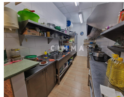
Amueblado, Bar, Todo exterior,

La información en este anuncio es solo para fines informativos y puede estar sujeta a cambios o errores. [IW]