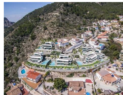
Barbacoa, Calefacción, Piscina privada, Terraza, Todo exterior,

Una oportunidad única de inversión o residencia habitual en una de las zonas más cotizadas del Mediterráneo.