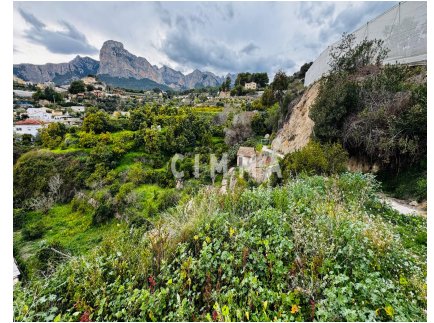
Depósito agua, Jardín, Piscina comunitaria, Rural,

Descubre este encantador terreno rural ubicado en Polop, que ofrece una superficie total de 2866 m 2 . Perfecto para los amantes de la naturaleza y el cultivo, esta propiedad cuenta con frutales exuberantes que prometen deleitar tus sentidos. Además, dispone de una práctica caseta para aperos donde podrás almacenar todo lo necesario para mantener tu pequeño oasis agrícola. La joya del lugar es su balsa de riego, ideal para asegurar un suministro constante a tus cultivos durante las épocas más secas. Situado cerca del pueblo, disfrutarás no solo del sosiego del campo sino también de fácil acceso a todos los servicios necesarios; ¡la combinación perfecta entre tranquilidad y comodidad! No pierdas la oportunidad única de convertirte en propietario/a de este hermoso espacio natural.